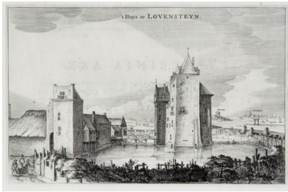
Slot Loevestein 1630, gravure C.J. Visscher, collectie Stichting Museum Slot Loevestein