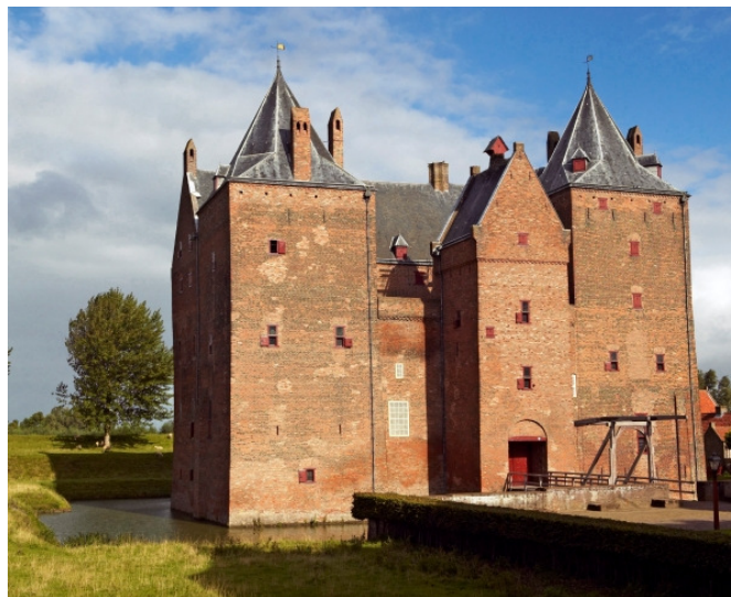
Foto van het huidige Slot Loevestein