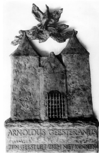
Plaquette op slot loevestein aangeboden door familie- vereniging