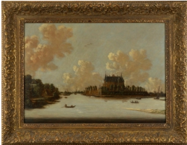
Slot Loevestein 17 e eeuw geschilderd door Jan van Meerhout. Collectie Stichting Museum Slot Loevestein

Iets later dan voorzien was werd het plan de nacht van 19 op 20 juli 1631 uitgevoerd: met een laddertje de muur over naar de Waal, waar een schuif ligt. Aan de overkant naast de dijk naar het riviertje de Linge waar weer een schuifje voor het gezelschap gereed ligt en dan anderhalf uur lopen naar Nieuwpoort (tegenover Schoonhoven).